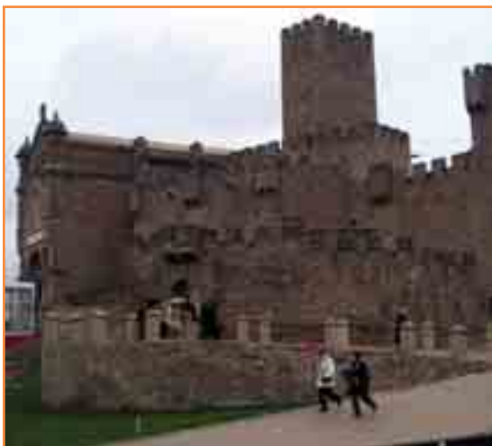
El Castillo de Javier recibió al grupo con toda su grandeza. Y con mal tiempo, todo hay que decirlo.