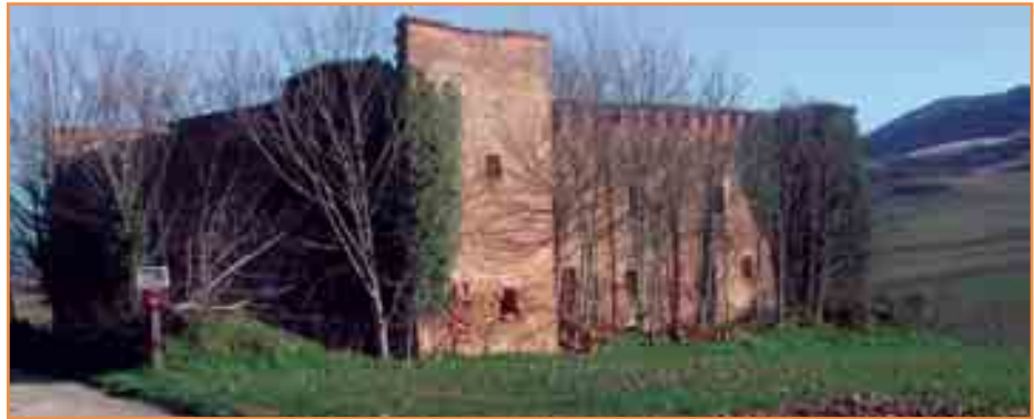
Vista del, por ahora, deshabitado pueblo de Guenduláin.

El Ayuntamiento de la Cendea de Cizur sigue el "tema Guenduláin" con la lógica máxima atención, persiguiendo un total acuerdo entre los diferentes grupos políticos para defender en común los intereses de la Cendea de Cizur.