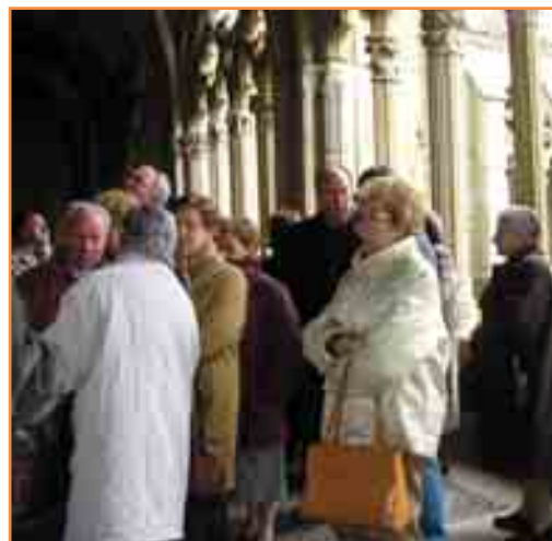
Imagen de la visita al Monasterio románico de la Oliva.