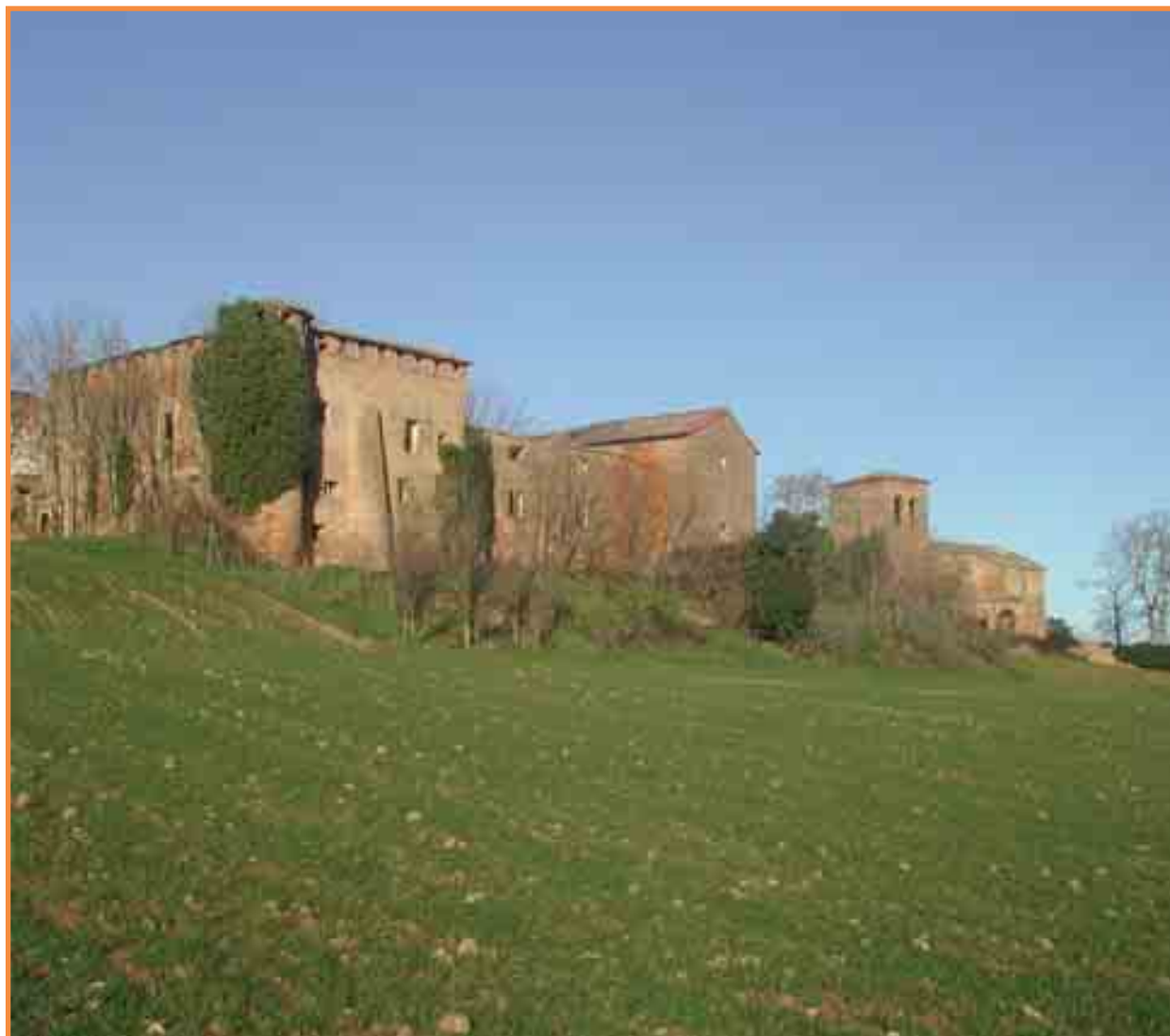
Imagen del lugar de Guenduláin, en la Cendea de Cizur.

AYUNTAMIENTO DE LA CENDEA DE CIZUR - ZIZUR ZENDEAKO UDALA