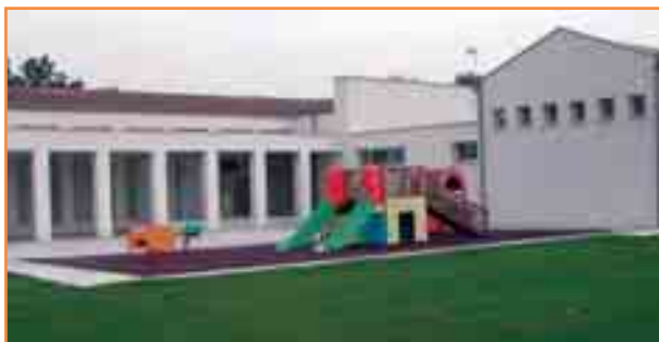
Zona de juegos de la escuela pública 0-3 de Zizur Mayor.

Podrán solicitar subvención aquellas organizaciones no gubernamentales y organismos de solidaridad sin ánimo de lucro, registrados como asociaciones en el