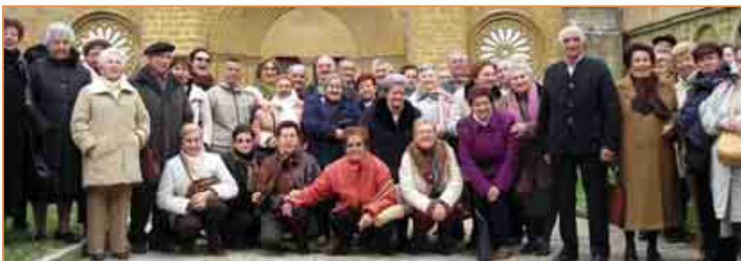
Las visitas al Monasterio de la Oliva y al Castillo de Javier fueron programadas en colaboración con el Club de Jubilados Santa Cruz de Zizur Mayor. Como se observa, el buen ambiente fue la tónica.